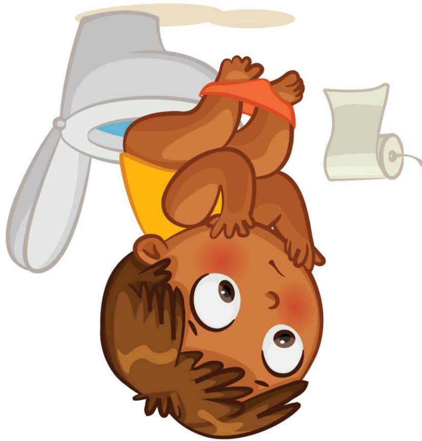
Abb.: © kharlamova_lv - fotolia