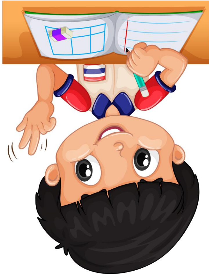
Abb.: © bluringmedia – fotolia