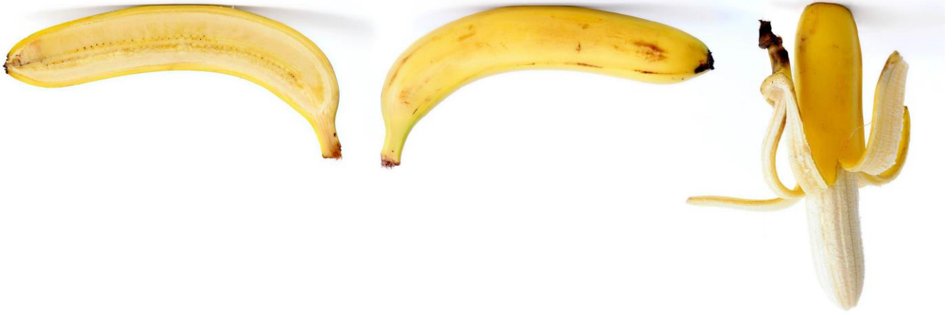
Abb.: © Fir0002-Flagstaffotos