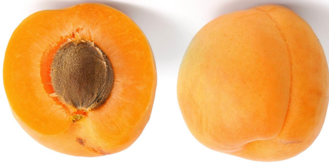
Abb.: © Fir0002-Flagstaffotos