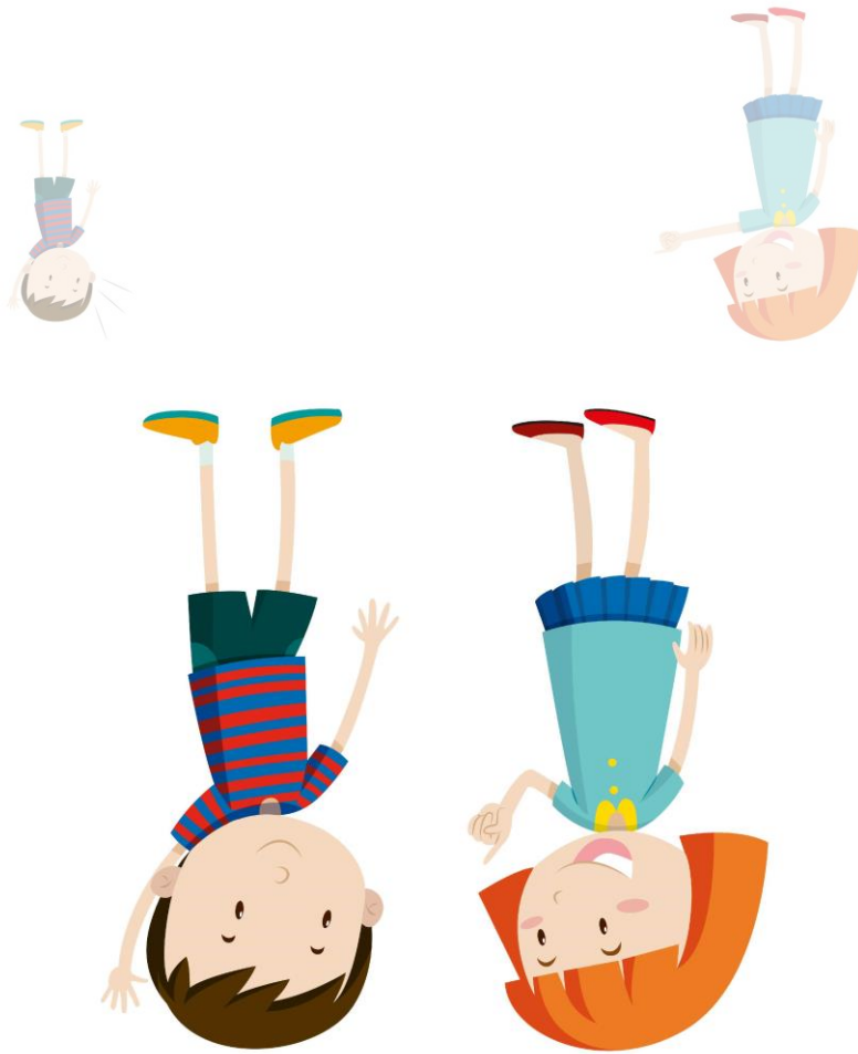
Abb.: © bluringmedia - fotolia